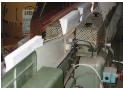
Limmet värms i en ugn ("u-båten").

– Det är verkligen bra att alla större leverantörer har öppnat sig för detta och anpassar sina system efter den här standarden.