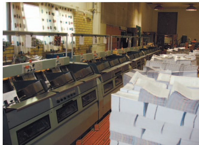
Helautomatisk trådbindningsmaskin av märket Duplex. Den kan hantera 15 arkdelar och har två symaskiner som syr ihop arkdelarna i ryggen.

PLÅTEXPONERING ▶ Trots att Almqvist & Wiksell ligger i framkant när det gäller ny teknik så har de kvar sin utrustning för plåtexponering. Anledningen är att de har ett filmföråd med läromedelsmaterial som