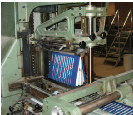
Det hårda omslaget fästs på ryggen.

OMÖJLIGT ATT FÖRPRODUCERA ▶ Den grafiska branschen skiljer sig mot andra producerande industrier på flera sätt. Ett faktum är att det till skillnad från bland annat verkstads-, bil- och medicinindustrin inte går att förproducera någonting – det går inte att göra något på lager.