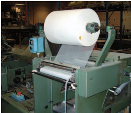
En gasremsa läggs på ryggen.