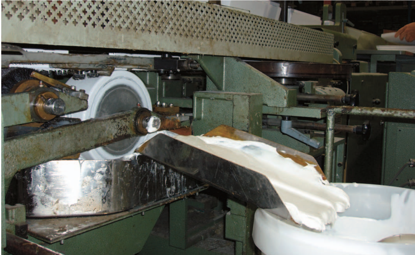
Lim läggs på de försydda arken.

mellan prepress-tryck-binderi. Kunderna ställer höga krav på pris och leveranssäkerhet och därför kan man inte vara i händerna på andra, förklarar Adolffson.